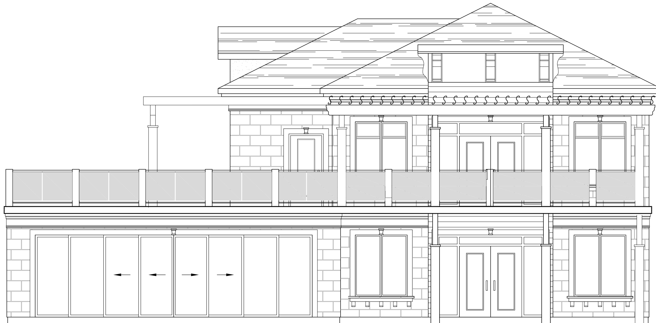
ÉLEVATION ARRIÈRE ÉCHELLE: 3/16"=1'-0"