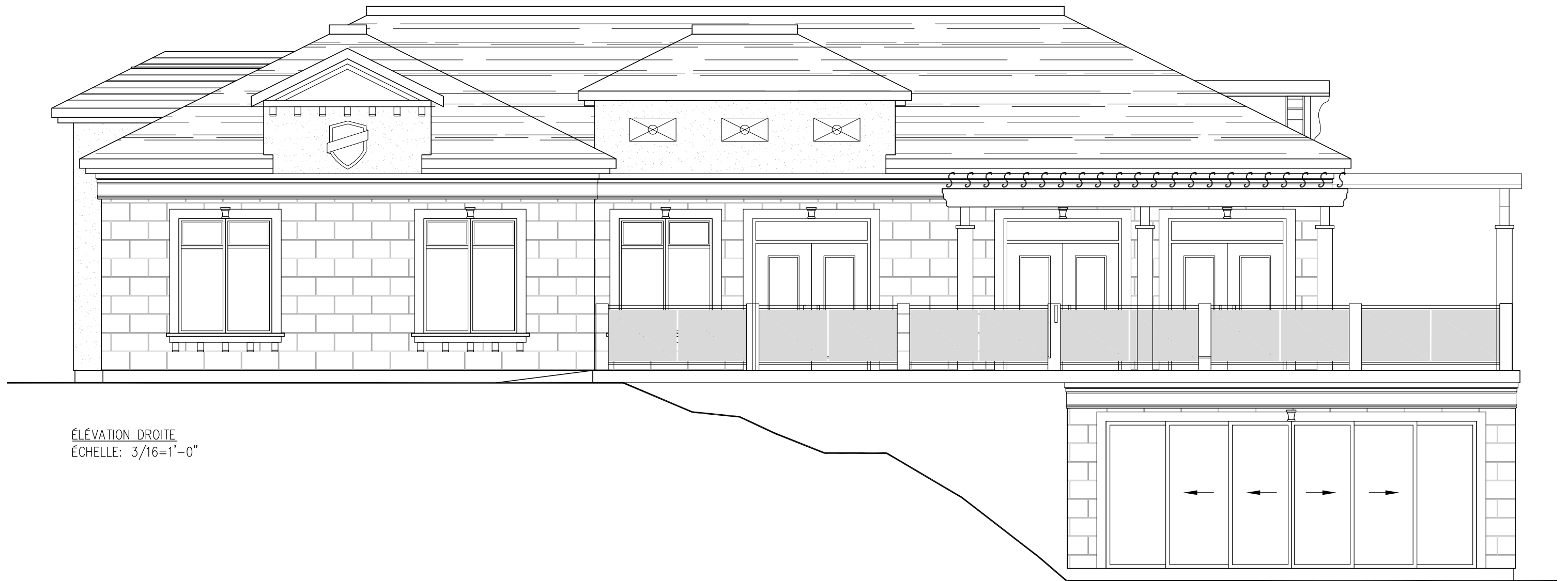
ÉLÉVATION DROITE ÉCHELLE: 3/16=1'-0"