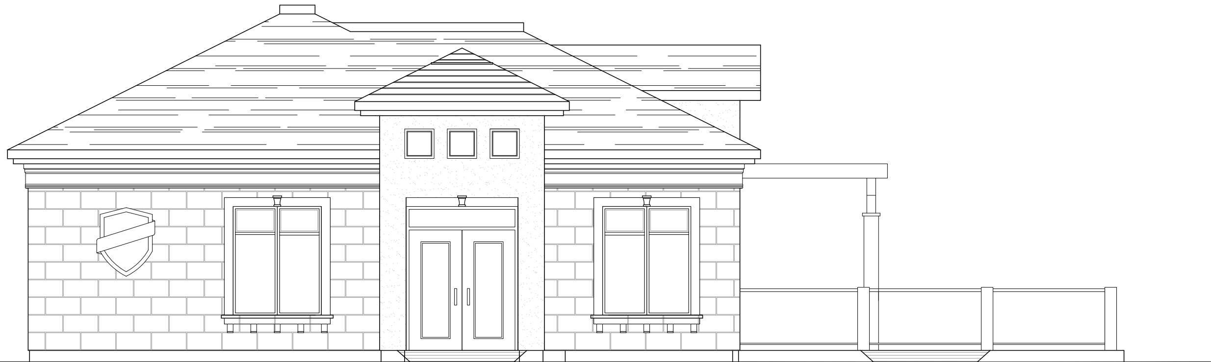
ÉLÉVATION AVANT ÉCHELLE: 3/16"=1'-0"